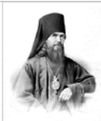
Свт. Феофан Затворник [23 янв., 29 июня н.ст.]

(Еф. 2, 4-10; Лк. 8, 26-39). Гадаринский бесноватый по исцелении своем прилепляется к Господу и желает быть с Ним всегда; затем, услышав волю Его, идет и проповедует о благодетелии, им полученном, по всему городу. Благодетель привлекает, воля Его становится законом для облагодетельствованного, и язык не может удержаться, чтоб не возвещать о том, что получено от Него. Если бы мы не имели в памяти всех благ, полученных и получаемых от Господа, то не было бы между нами неблагодарных, не было бы нарушителей святой воли Его, не было бы таких, которые не любили бы Его более всего. В крещении мы избавлены от прародительского греха и всей погибельности его; в покаянии постоянно омываемся от грехов, непрестанно прилипающих к нам. Промышлением Божиим охраняемся от бед, нередко невидимых для нас самих, и получаем направление жизни наиболее безопасное для нас и благоприятное целям нашим; да и все, что имеем, все от Господа. Потому-то нам следует вседушно принадлежать Господу, во всем исполнять волю Его и прославлять имя Его пресвятое, а наипаче жизнью и делами, чтоб не быть хуже гадаринского бесноватого, который сразу оказался настолько мудрым, что стал достойным примером подражания для всех.